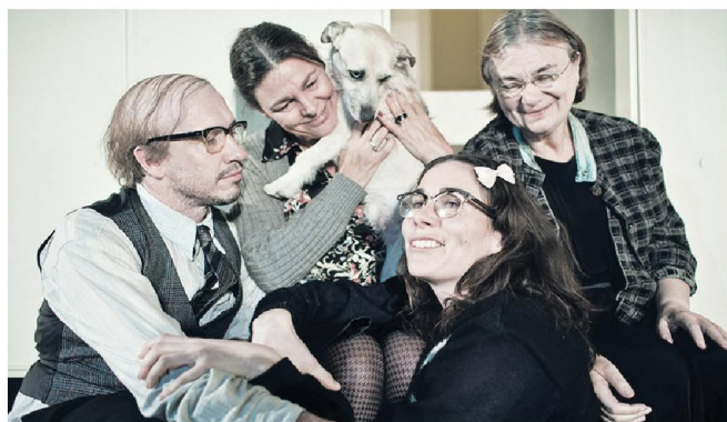
In Kinderen van de Zon (2010-2012).