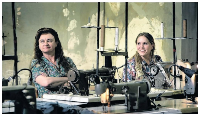
In Maeterlinck (2007).