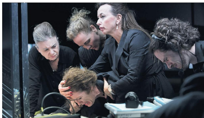
In Romeinse tragedies (2012).