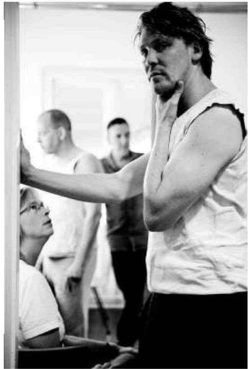
Prijs voor de beste mannelijke bijrol in 'Dood van een handelsreiziger'.

In één prachtige scène laat hij die emoties elkaar zo snel opvolgen dat zijn innerlijk conflict hartverscheurend zichtbaar wordt. „Het sluimert en gist in deze jongen en de uitbarsting daarna is even beheerst als dramatisch”, schrijft de jury.