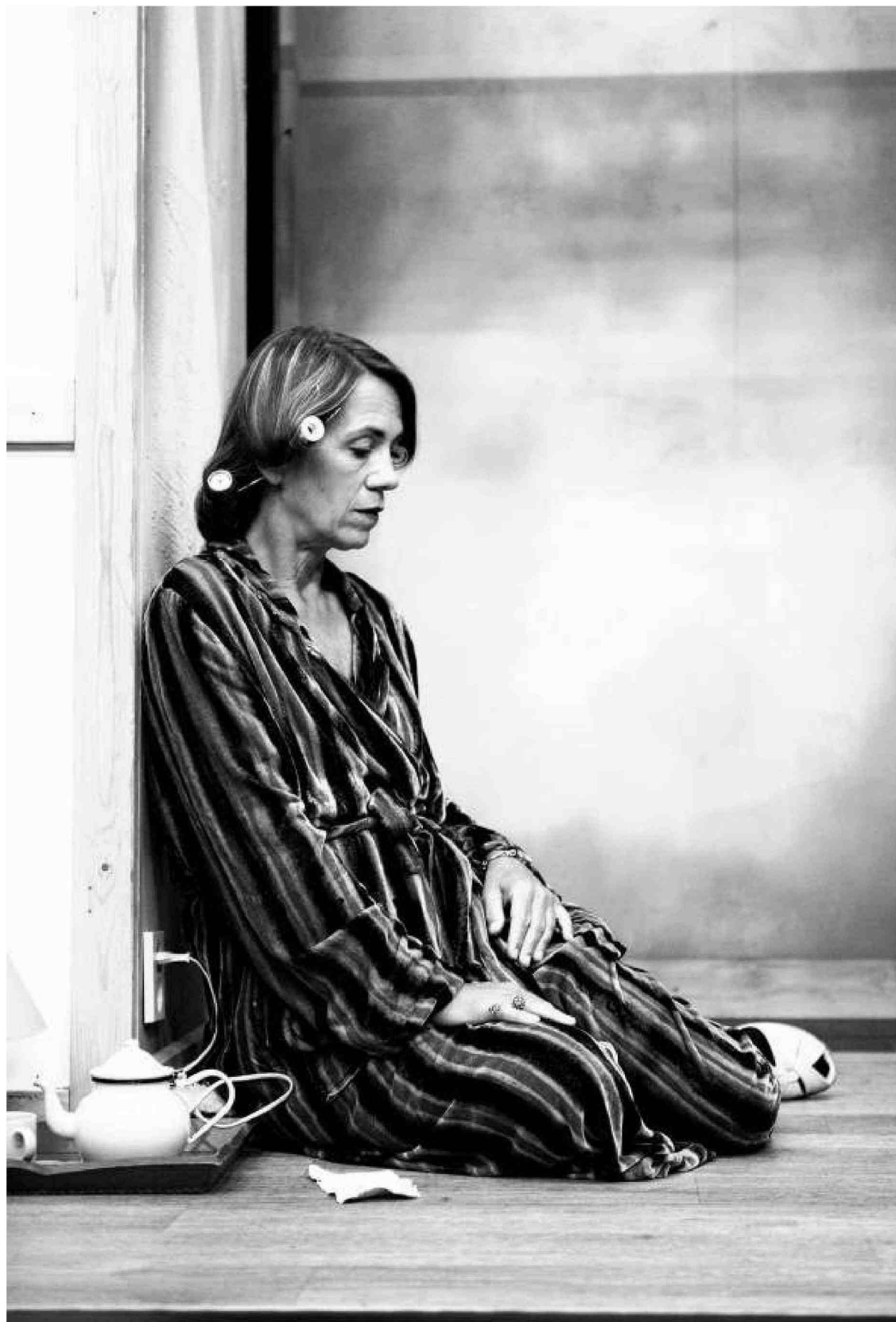
Prijs voor de beste vrouwelijke hoofdrol voor haar spel in 'Am Ziel'.