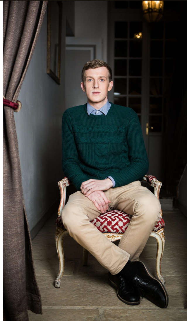
'Theater was een vluchtweg, een manier om te ontsnappen aan mijn kindertijd die ik haatte.'

Zowel Ostermeier als Van Hove raakte bevriend met Louis en voerde lange gesprekken met hem. Bij Ostermeier bracht Louis zelfs enkele weken in de repetitieve ruimte door en schreef hij nieuwe dialogen. Voor Louis was het een welgekomen afwisseling; niet drie jaar alleen in zijn kamer werken, zoals bij een nieuw boek, wel collectieve arbeid. Maar er speelde meer, vertelt Louis. 'Op het podium had ik de kans om de beelden uit mijn hoofd live te creëren. Dat was extreem emanciperend. Het is een positieve appropriatie: de acteurs namen mijn verhaal over, zodat ik er niet mee moest dealen. Het werd hun gevecht. Os-