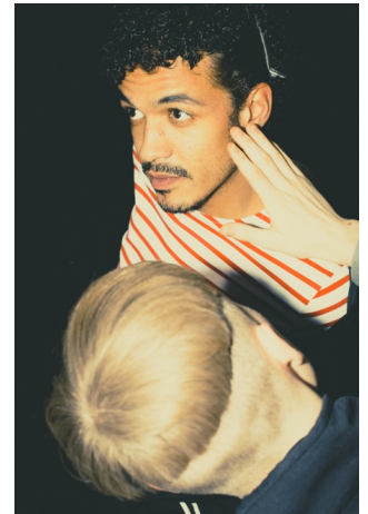
'Weg met Eddy Bellegueule', © Mette Stam