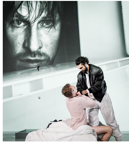
'Geschiedenis van geweld'

Evelly vrienden had de jonge Eddy Bellegueule, zoals hij heette vooraleer hij zijn naam veranderde in Edouard Louis, niet. Dus ging hij naar ieder nieuw clubje, waaronder de theaterklas. 'Acteren ging zo vlot, want door de harde wereld waarin ik leefde, was ik