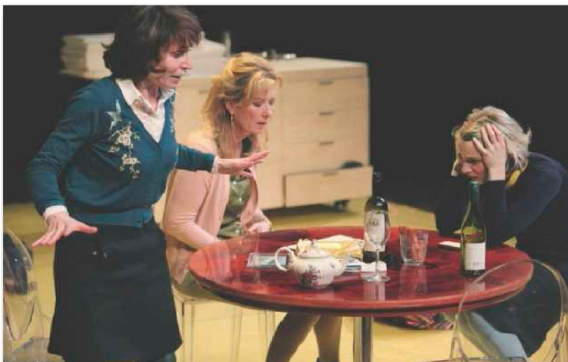
De Freudjes, geen familie. V.l.n.r. Lineke Rijxman, Ariane Schluter en Karina Smulders

“Voor het stuk waarin ik nu speel heb ik Van oude mensen, de dingen, die voorbijgaan van Louis Couperus voor het eerst gelezen. Toegegeven: je moet even de tijd uitzetten en wennen aan het archaïsche taalgebruik, maar als je dat hebt gedaan, zie je hoe goed en eigentijds zijn werk nog steeds is. Ik vond het mooi om te lezen hoe reëel hij in dit boek over het huwelijk schrijft. Mensen verwachten tegenwoordig veel van het huwelijk – het moet één groot feest zijn, jij en je vrouw moeten elkaar het liefst de hele dag op willen eten. Alles moet maar leuk zijn tegenwoordig. Op Facebook zie je niets anders dan ‘leuke’ updates. Couperus schrijft: als je getrouwd bent, dan is het geven en nemen, schipperen om het bootje op koers te houden. Couperus geeft dat mooi weer. Het boek mag dan meer dan honderd jaar geleden geschreven zijn, maar het zet ons met beide benen op de grond.”