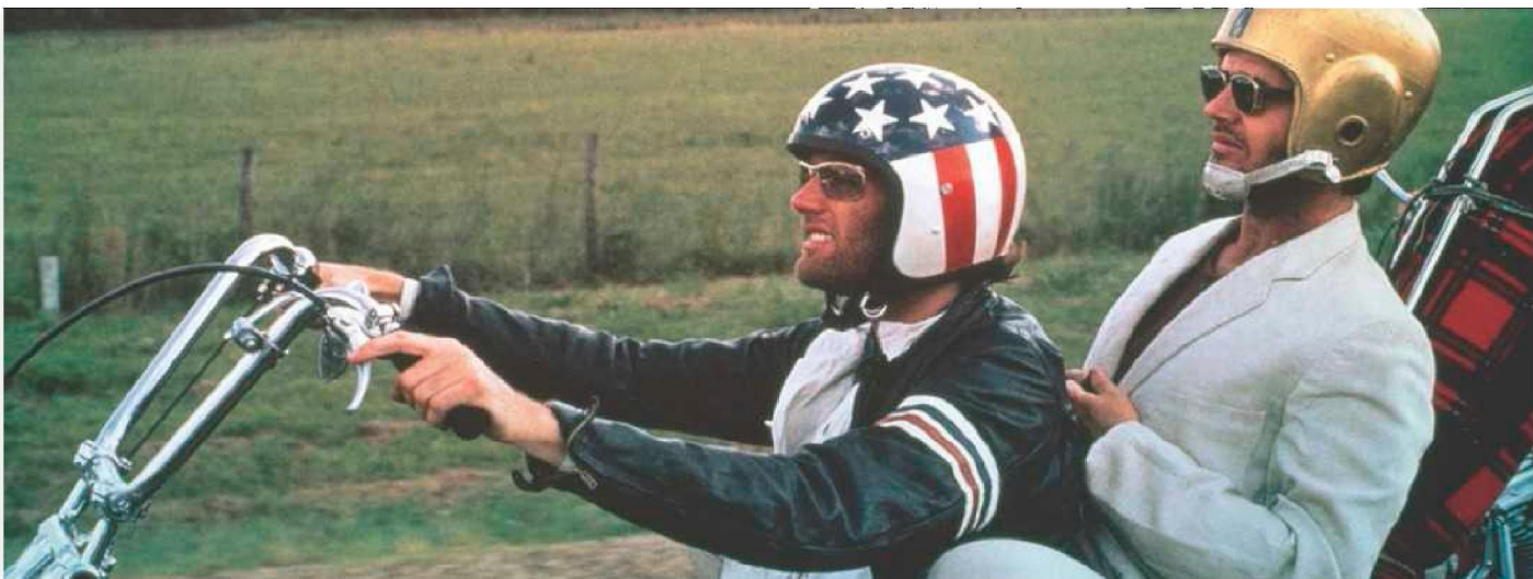
Uit de film Easy Rider (1969)