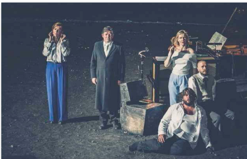
De Vreemden van NTGent